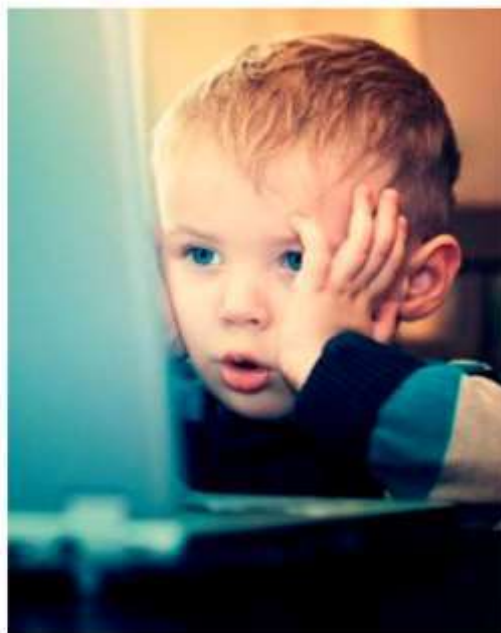
Интернет может быть опасен!

ДЕТЯМ ДО 5 ЛЕТ НЕ РЕКОМЕНДУЕТСЯ ПОЛЬЗОВАТЬСЯ КОМПЬЮТЕРОМ. ДЕТЯМ 5-7 ЛЕТ МОЖНО -ОБЩАТЬСЯ- С КОМПЬЮТЕРОМ НЕ БОЛЕЕ 10-15 МИНУТ В ДЕНЬ 3-4 РАЗА В НЕДЕЛЮ.